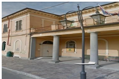
Primaria di Desana