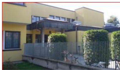
I Grado di Villata