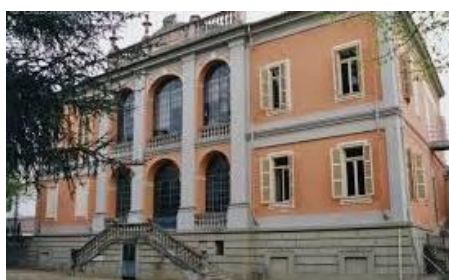
I Grado di Asigliano