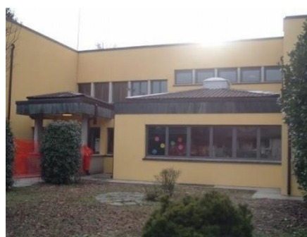
Primaria di Villata