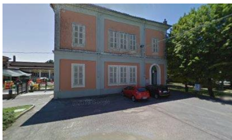
Primaria di Asigliano