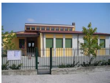
Primaria di Ronsecco